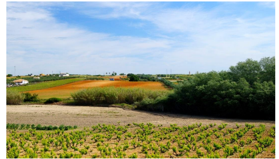
Foto 2. Mosaico de cultivos al sur de Rociana del Condado. Autor: Rafael Medina Borrego.