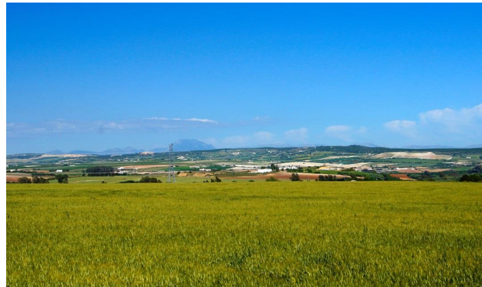
Foto 1. Campiñas próximas a la Junta de los Ríos con la sierra de Cádiz al fondo.