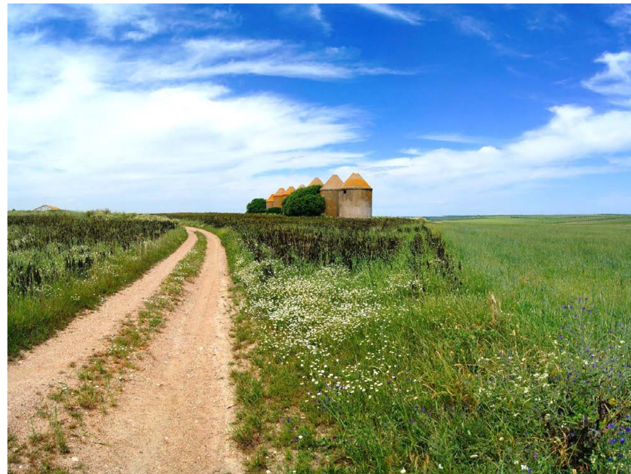
Foto 3. Palomares en la campiña de Trigueros.