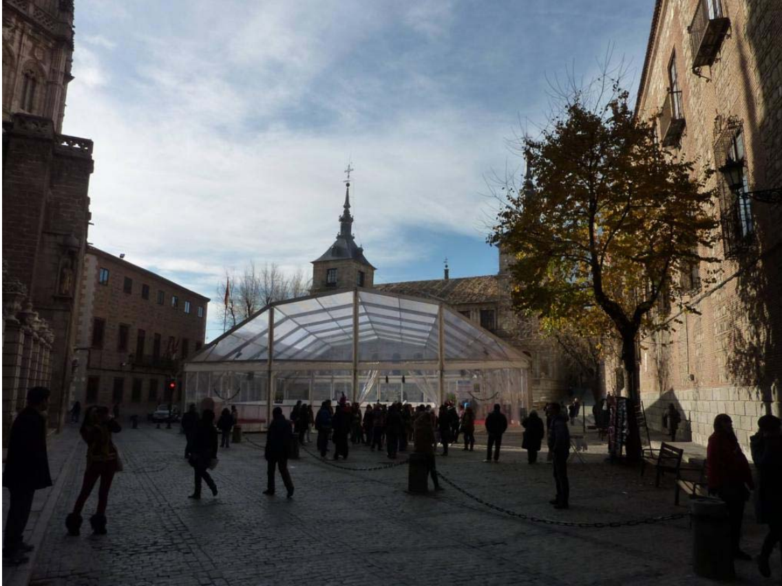
Figura nº 10. Pista de patinaje sobre hielo en Toledo junto a la catedral y el ayuntamiento.

transitar cotidiano (la salida o vuelta a casa, ocasionales juegos infantiles, breves paseos de residentes mayores y animales domésticos, etc.). En no pocos casos es creciente la sensación y la tendencia real de espacios desiertos o poco hospitalarios que se transitan con premura desde el estacionamiento del automóvil o la parada del transporte público al portal de la vivienda o edificio propio.