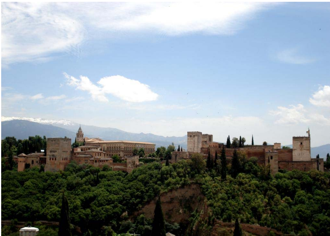
Figura nº 7. La Alhambra, conjunto monumental y lugar conspicuo que preside la ordenación de la ciudad de Granada.

paisaje urbano, con objeto de identificar los hechos que se perciben y expresan formalmente la transición entre estructuras espaciales (del espacio privado al público, de un barrio a otro, etc.). También se han hecho algunas aportaciones conceptuales que refuerzan el sentido paisajístico del hito, tanto en el aspecto funcional como en el simbólico, para fortalecer su condición estructurante. Los hitos pueden alcanzar la condición de hecho o “lugar conspicuo”, circunstancia que le confiere un especial valor hasta convertirlos en referente principal de la ordenación 95 ; en otras ocasiones cuando el hito es además un importante equipamiento público repercute igualmente en aspectos funcionales y de ordenación urbana 96 . Tanto la distinción de nodos de concentración o articulación, como el reforzamiento de los hitos pueden tener consecuencias prácticas en la planificación y gobierno de la ciudad, según se abordará en el penúltimo apartado de este escrito (Figura nº 7).