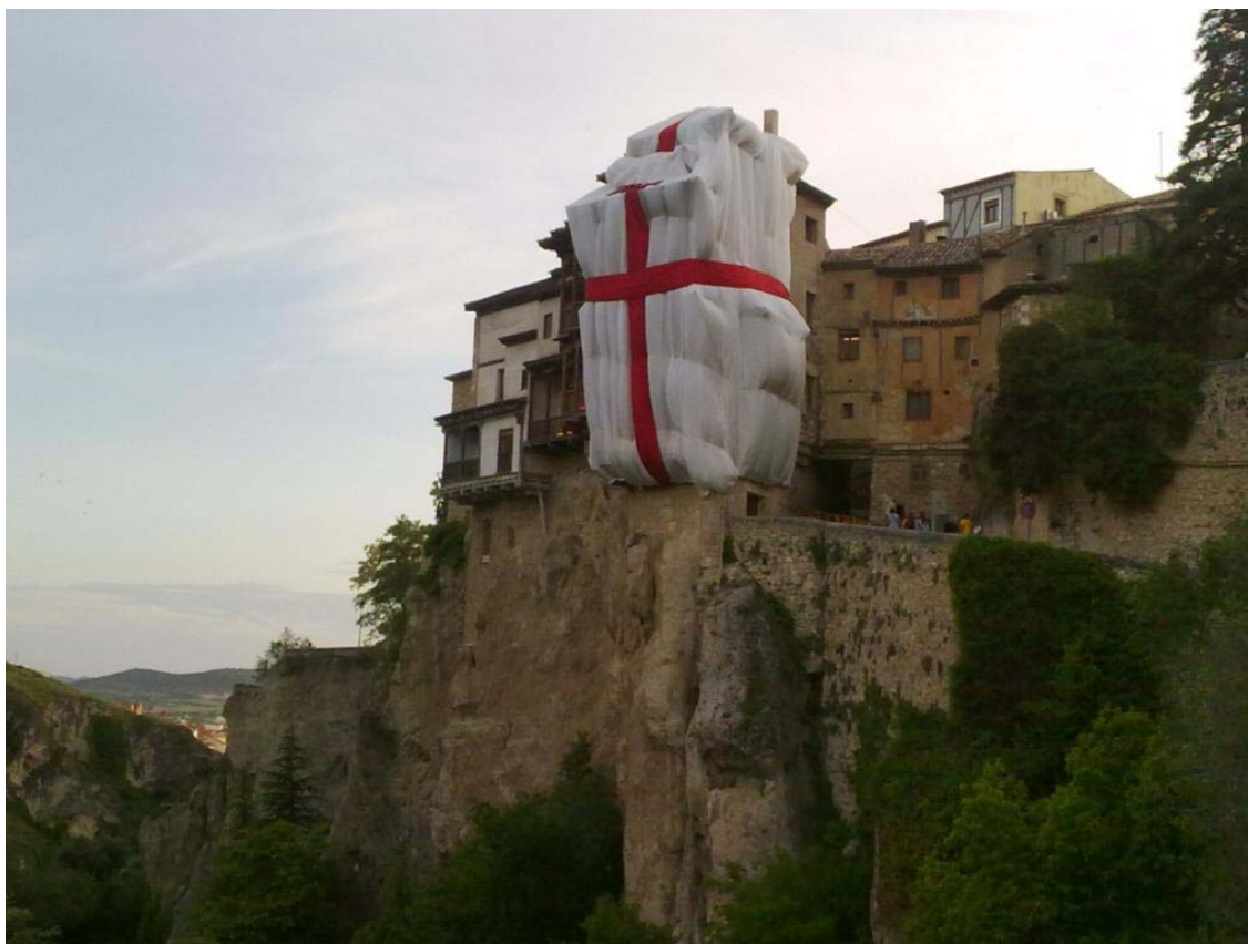
Figura nº 2. Casa colgada de Cuenca.

los más conocidos; su forma de hacer se generaliza más tarde (Figura nº 2) en manifestaciones personales o colectivas con propósito artístico o social y en diversos sentidos 38 . Mención particular merece el autodenominado “arte urbano reivindicativo”, que realiza diversas manifestaciones estéticas participativas; actividades en calles y plazas como “ la ciutat de les paraules ” en Barcelona, los recorridos de “ deriva urbana ” en otras muchas ciudades, el movimiento walkscapes o stalker que recorre las periferias urbanas, las pintadas estridentes de casas y los grafiti dedicados a la libre expresión artística en tapias, muros, medianeras, edificios abandonados, elementos del mobiliario urbano, etc. Estas actuaciones fueron promovidas originariamente por grupos juveniles contestatarios, pero han sido progresivamente asimiladas por capas sociales más amplias y convertidas en una modalidad de expresión con evidentes repercusiones en doble sentido, la utilización del paisaje urbano como vía de expresión y su incidencia en la imagen de la ciudad 39 .