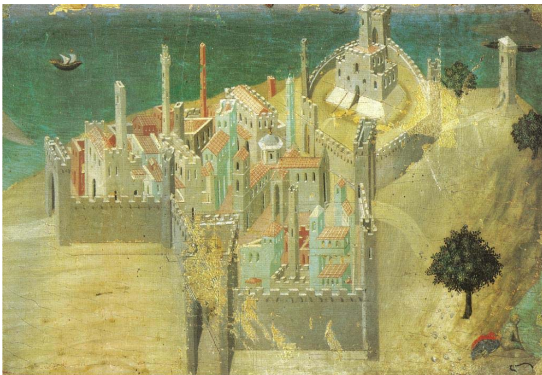
Figura 1: Lorenzetti. Ciudad al borde del mar , 1335. Pinacoteca Nacional de Siena.

Más tarde, en murales y retablos medievales, en las miniaturas de los códices y en los primeros “lejos” de las pinturas prerrenacentistas son ya claramente apreciables los esfuerzos por transmitir la presencia de la ciudad entera (Figura nº 1); del final de esta etapa, la representación realizada por Ambrogio Lorenzetti (1338-1339) en el Palazzo Comunale de Siena sobre el “Buen y mal gobierno y sus efectos sobre la ciudad y el campo” ha sido considerada por diferentes autores 26 como la expresión icónica de un programa político que reconoce en el territorio y en el paisaje unas potencialidades ampliamente desarrolladas en décadas y siglos posteriores. En este caso, la mejor conservación del mural que refleja el “buen gobierno”, permite hoy la contemplación de un interesante paisaje urbano bajomedieval realizado con un propósito aleccionador.