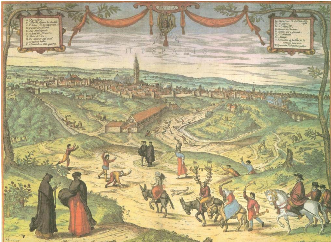
Figura nº 4. “Quien no ha visto Sevilla no ha visto maravilla”. Joris HOEFNAGEL, ca. 1565.

En la imagen de conjunto de cada ciudad trascienden generalmente los hechos principales del medio en el que se inserta sobre todo la conformación natural de su emplazamiento o solar concreto ocupado. Las ciudades históricas, más condicionadas que las de implantación reciente por estas causas, muestran en su compacidad, en los materiales constructivos y en la forma de las cubiertas de los edificios, su adecuación al clima, y en las trazas dominantes del viario y en la localización de ciertos edificios principales, su adaptación al relieve y a la red fluvial; ambos conjuntos de características asientan las peculiaridades formales básicas de la ciudad, reflejada no sólo por su apariencia externa o textura, sino también por su estructura unitaria; textura y estructura forman parte sustancial de la imagen de conjunto y permiten establecer la “legibilidad” de la ciudad en expresión de Kevin Lynch 75 , pero no son sus únicos componentes. La situación y el emplazamiento condicionan sustancialmente la imagen urbana de conjunto, sobre todo en asentamientos que eligieron lugares estratégicos como colinas aisladas, cabos o morros litorales, meandros encajados, etc. Excepciones significativas a esta afirmación son los casos en los que condicionantes ideológicos o normativos se superponen indiferentes a las características físicas del lugar ocupado 76 .