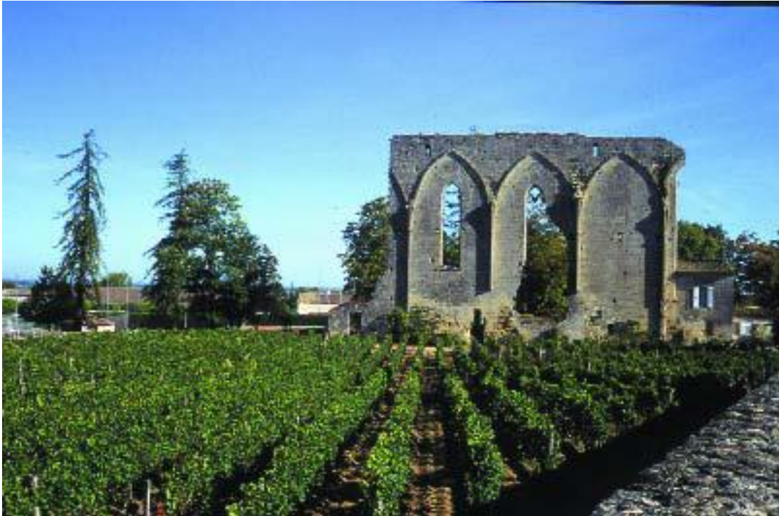
Figura nº 6. Viñedo en el borde urbano de Saint Emilion, Burdeos.

implantación de usos, instalaciones o edificios incongruentes, etc.) o positivamente (localización óptima de miradores, acondicionamiento o creación de secuencias visuales que refuercen el atractivo paisajístico de la ciudad, etc.). Ante la complejidad funcional de cualquier núcleo urbano (incluidos los pequeños y medianos) resulta de interés plantearse sobre qué accesos conviene reforzar la consideración positiva de la imagen urbana de conjunto (calidad de ésta, cuantificación de la frecuentación, cualificación del observador, etc.) y con cuáles relacionar actividades que pueden restarle valor pero de presencia y localización imprescindibles 80 .