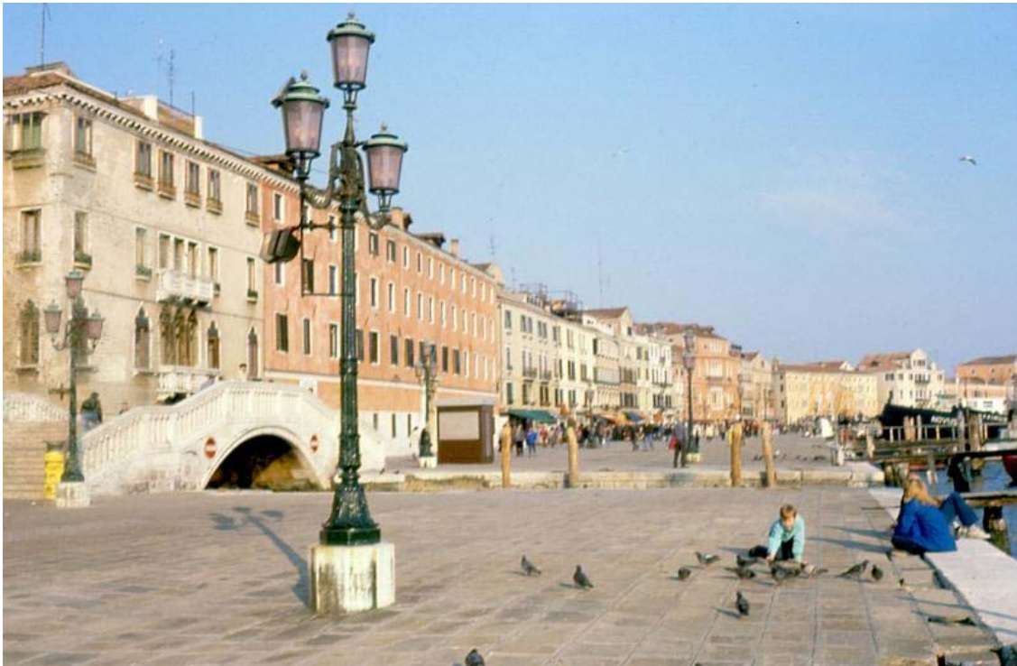
Figura nº 5. Riva degli Schiavoni. Venecia.

Forman también parte destacada de la imagen urbana de conjunto las fachadas y frentes urbanos. Principalmente porque con gran frecuencia han sido los espacios elegidos para captar y ofrecer la imagen unitaria de la ciudad. Este componente puede ser asociado al término de “borde” urbano utilizado por Kevin Lynch, pero prefiero dar a esta última palabra un sentido más específico que trataré más adelante. Los frentes y fachadas urbanas pueden ser externos o internos, es decir formar parte de la imagen de conjunto o del paisaje urbano interior, aunque la circunstancia que los explica es siempre la misma, la distancia creada por un vacío o espacio no construido que habilita una más amplia perspectiva urbana (Figura nº 5).