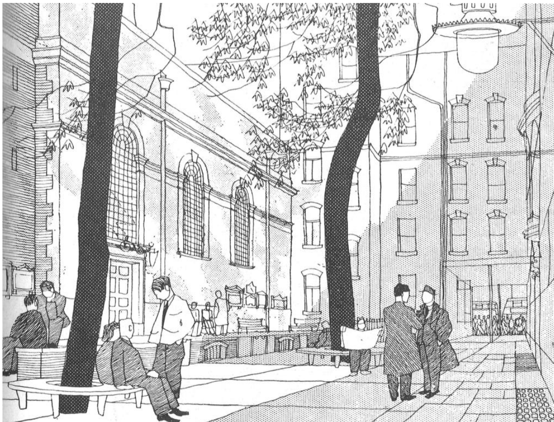
Figura nº 3. Plazoleta. Dibujo incluido en el libro de Gordon CULLEN (1974).

Sin duda ambos libros se han convertido en referencias significativas en la evolución de las ideas sobre los paisajes urbanos, principalmente en su aplicación a la ciudad occidental contemporánea y, sobre todo, entre arquitectos, diseñadores de espacios libres y urbanistas; pero las dos obras carecen de una consideración suficiente de los aspectos que explican la forma urbana, su base natural y el proceso histórico que las une a su funcionalidad; tampoco contienen desarrollos teóricos suficientes. Han servido para que entre los estudiosos y profesionales de los enfoques antes citados creciera la atención prestada a los aspectos perceptivos de los paisajes urbanos; en este aspecto, la concepción del paisaje en ambas obras se acerca a la definición del paisaje incluida en el Convenio de Florencia. De años siguientes cercanos son las obras de Cliff Tandy y Richard Smardon, menos citadas pero con gran interés práctico y gran reflejo en la arquitectura paisajista y en el diseño urbano, aunque carentes de planteamientos teóricos 61 .