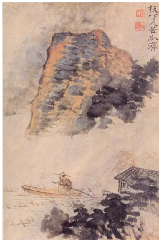
Shitao. El pescador bajo el acantilado . Museo de Shanghai

En China la unión entre pintura, poesía y filosofía vincula tempranamente agua y paisaje. La idea de vacío, fundamental en el taoísmo, se asocia pictóricamente a la imagen del valle y ésta, obviamente, al agua. La célebre frase de las Analectas de Confucio “el hombre de corazón se encanta con la montaña; el hombre de entendimiento disfruta del agua” (8), está ligada históricamente a un largo desarrollo de la pintura china de paisajes (literalmente “pintura de montaña y agua”), en la que agua y montaña se constituyen metafóricamente no sólo en los dos polos de la naturaleza, sino también en lo horizontal y lo vertical, lo femenino y lo masculino, la tinta y el pincel; pero, lo más importante, como nos señala François Cheng, es que la interacción entre montaña y agua, el paisaje, encarna la transformación universal en la que están implícitas las leyes de la vida humana. “El paisaje, retrato del hombre”, titula este autor para subrayar que “el pintor chino, a partir de los siglos IX y X, privilegia el paisaje, que, a la par de revelar el misterio de la naturaleza, le parece adecuado para expresar a la vez los sueños y los rasgos profundos” del ser humano (9).