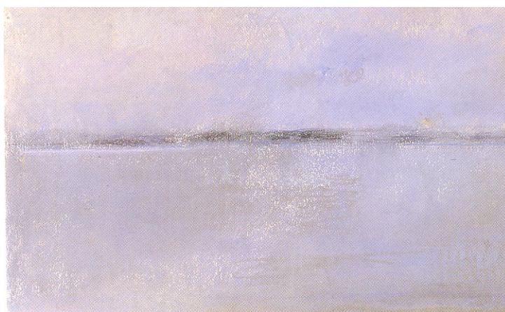
C. Laffon. Vista del Coto . Colección privada. Sevilla.

Como aspecto positivo con importante repercusión real, aunque no plenamente generalizada, debe señalarse que el incremento en la depuración de aguas residuales (imprescindible por motivos sanitarios y ecológicos) está teniendo un inmediato efecto favorable en bastantes espacios fluviales; principalmente por la mejora de la calidad de las aguas, pero también por su repercusión ambiental y paisajística; es fácilmente comprobable la tendencia que se está produciendo en muchos núcleos de población (pueblos, ciudades pequeñas y medias) a que las edificaciones residenciales –viviendas unifamiliares y bloques- que tradicionalmente han presentado sus corrales y puertas traseras al río se giren y den ahora sus fachadas a cursos saneados, estén o no regulados (28).