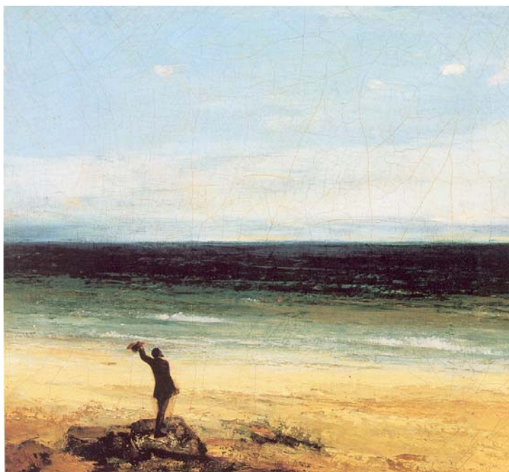
G. Courbet. El mar en Palavás . Museo Fabre. Montpellier

El mar es el primordial paisaje del agua. El paisaje en que el agua tiene mayor presencia y genera los sentimientos más duraderos de pertenencia a un lugar. Las palabras de Albert Camus son bien elocuentes al respecto: “Crecí en el mar y la pobreza me fue fastuosa; perdí el mar y entonces los lujos me parecieron grises, la miseria intolerable” (12).