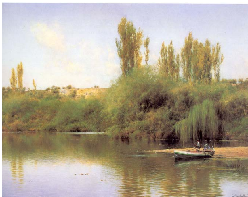
E. Sánchez Perrier. Orillas del Guadaira con barca. Colección Thyssen-Bornemisza. Madrid.

Se calcula que Andalucía ha perdido –principalmente por trabajos de desecación con fines agrícolas realizados en el siglo XX- la mitad de sus humedales (unos 120) y casi dos terceras partes de su superficie de zonas húmedas (aproximadamente 130.000 ha.); entre ellos algunos espacios tan singulares como la laguna de la Janda, o de tan importantes repercusiones ecológicas como las marismas del Guadalquivir en su margen izquierda (22).