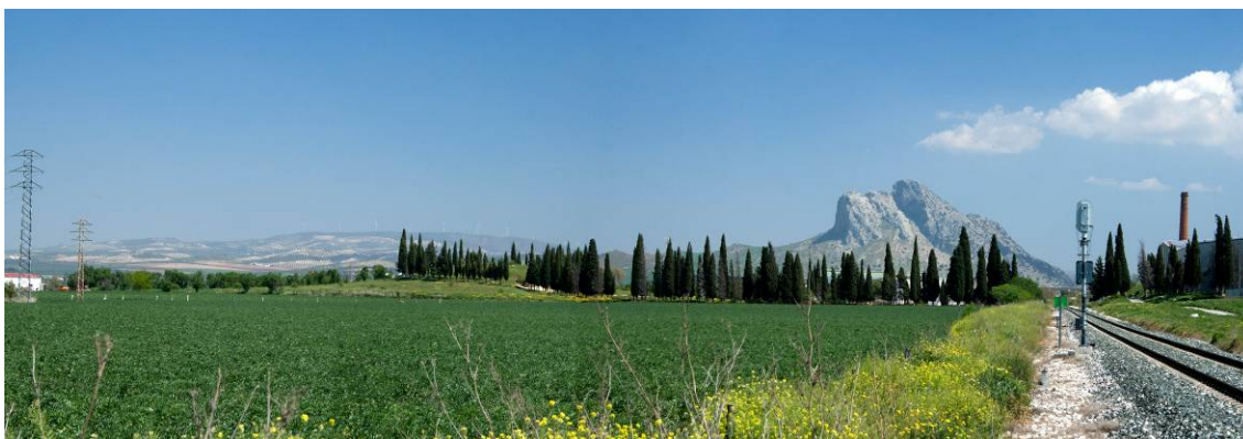
Fig. nº 1. Los constructores de los dólmenes de Menga, Viera y el Romeral en la actual Antequera relacionaron estos monumentos con el territorio inmediato con una visión general actualmente identificada como paisajística.

Menos reconocida, en parte debido a sus vacilaciones, es la línea científica de interpretación de los paisajes mediante la reconstrucción de los procesos históricos que los generan, aunque con gran frecuencia se repite la metáfora del paisaje como “palimpsesto” o como “totalizador histórico” (García Fernández, 1975), es decir al entendimiento del mismo como espacio reelaborado a través de los siglos que contiene, más o menos visibles, las huellas de las distintas culturas y sociedades que lo han ocupado o manejado y dejado evidencia de los valores, utilitarios o simbólicos, que fueron atribuidos a un determinado territorio en distintos momentos. Se trata sin duda del enfoque científico más costoso pues conforme se retrocede en el tiempo se dispone de menor información y se dificulta la comprobación. Estas circunstancias han provocado dudas, cansancio o desinterés ante el paisaje incluso en quienes habían puesto en él grandes expectativas científicas, pero aportaciones recientes como las realizadas por la Arqueología del Paisaje (Criado Boado, 1999) o teorías como las del Geosistema-Territorio-Paisaje (Bertrand, 2002) han reavivado el interés por esta noción, todavía no homogéneamente captada, entre geógrafos, antropólogos y especialistas en distintas etapas históricas que, a veces, la utilizan como concepto sinónimo de territorio o la reducen en su aplicación a espacios singulares y especialmente valiosos.