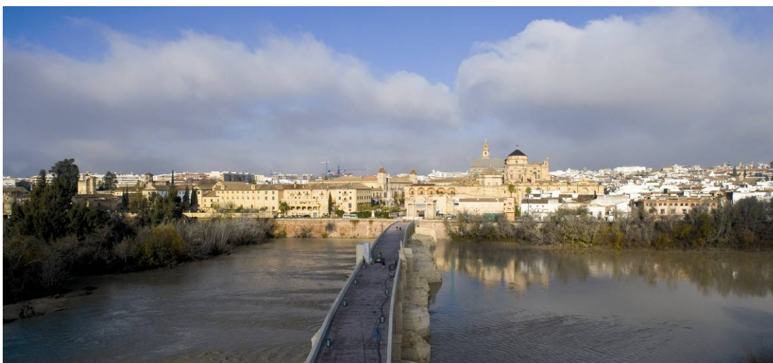
Fig. nº 3. La modificación del régimen fluvial ha producido el desarrollo de la vegetación en los Sotos de la Albolafia en las inmediaciones de la Mezquita-Catedral de Córdoba.

el concepto de protección, se está produciendo actualmente en las orillas del río Guadalquivir a su paso por la ciudad de Córdoba; la regulación del régimen fluvial y la normalización de los caudales han dado lugar a una mayor sedimentación en un tramo del curso medio del río y, con base en ello, a la ocupación de buena parte del cauce por una vegetación abundante que acoge a una rica avifauna, permanente y migratoria, habiéndose constituido en pocos años un paraje singular, los Sotos de la Albolafia, que ha merecido ser protegido como “monumento natural” (2001), pero cuya actual frondosidad resta visibilidad a la fachada urbana en las proximidades de la Mezquita-Catedral declarada a su vez bien de interés cultural y lugar perteneciente al patrimonio mundial. En consecuencia dos finalidades o motivos diferentes de protección convergen y se oponen en un mismo lugar: la reciente formación de un hermoso espacio con importantes valores naturalísticos en una densa área urbana (lo que para muchos ciudadanos acrecienta su valor) y la afectación u ocultación de un paisaje urbano connotado con la máxima estimación cultural. Este ejemplo pone de manifiesto, por una parte, que no cabe dar primacía a una modalidad de protección sobre otra y también que la noción de paisaje, es decir el entendimiento del lugar como único y por el conjunto de los valores presentes, puede ayudar a resolver el aparente dilema.